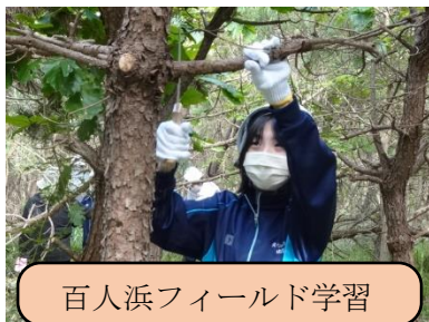
百人浜フィールド学習