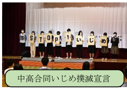
中高合同いじめ撲滅宣言