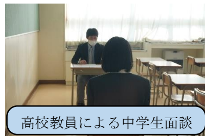
高校教員による中学生面談