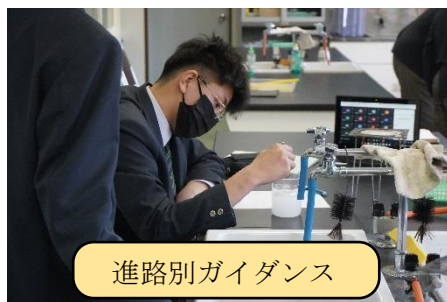
進路別ガイダンス