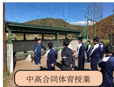
中高合同体育授業