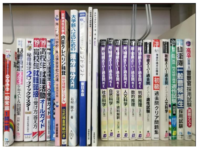
民間就職参考書、公務員試験問題集